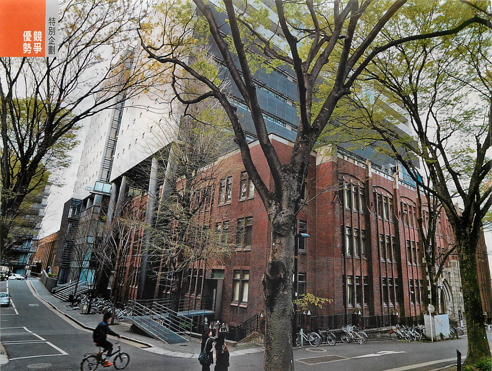
▲在保存古建築的原則下完成的東大工學部二號館，是東大重要的實驗基地，投入節能設備更新的投資，二年就回本。